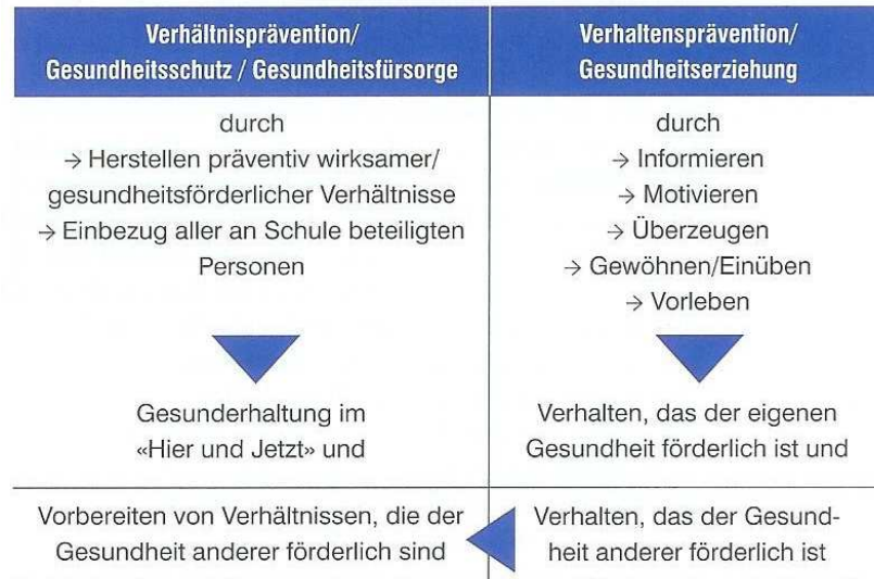
1: Die beiden Säulen der Gesundheitsförderung in der Schule

aus: Etschenberg, K.: Gesundheitsförderung in der Schule. In: UB 330/2007, S. 2